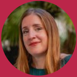
Aude, Département du Nord

Quelle énergie ! Nous avons été transportés à 500 tout de même grâce à cet optimisme déferlant. Un satisfecit complet pour notre premier séminaire des managers à Douai !